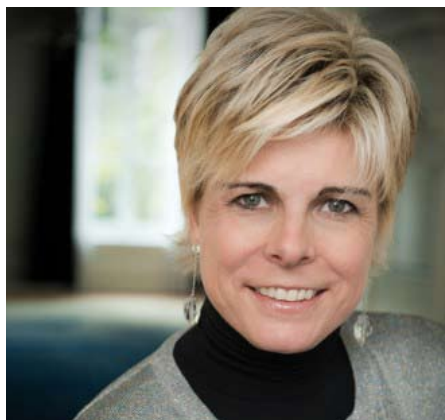
Laurentien van Oranje, executive fellow