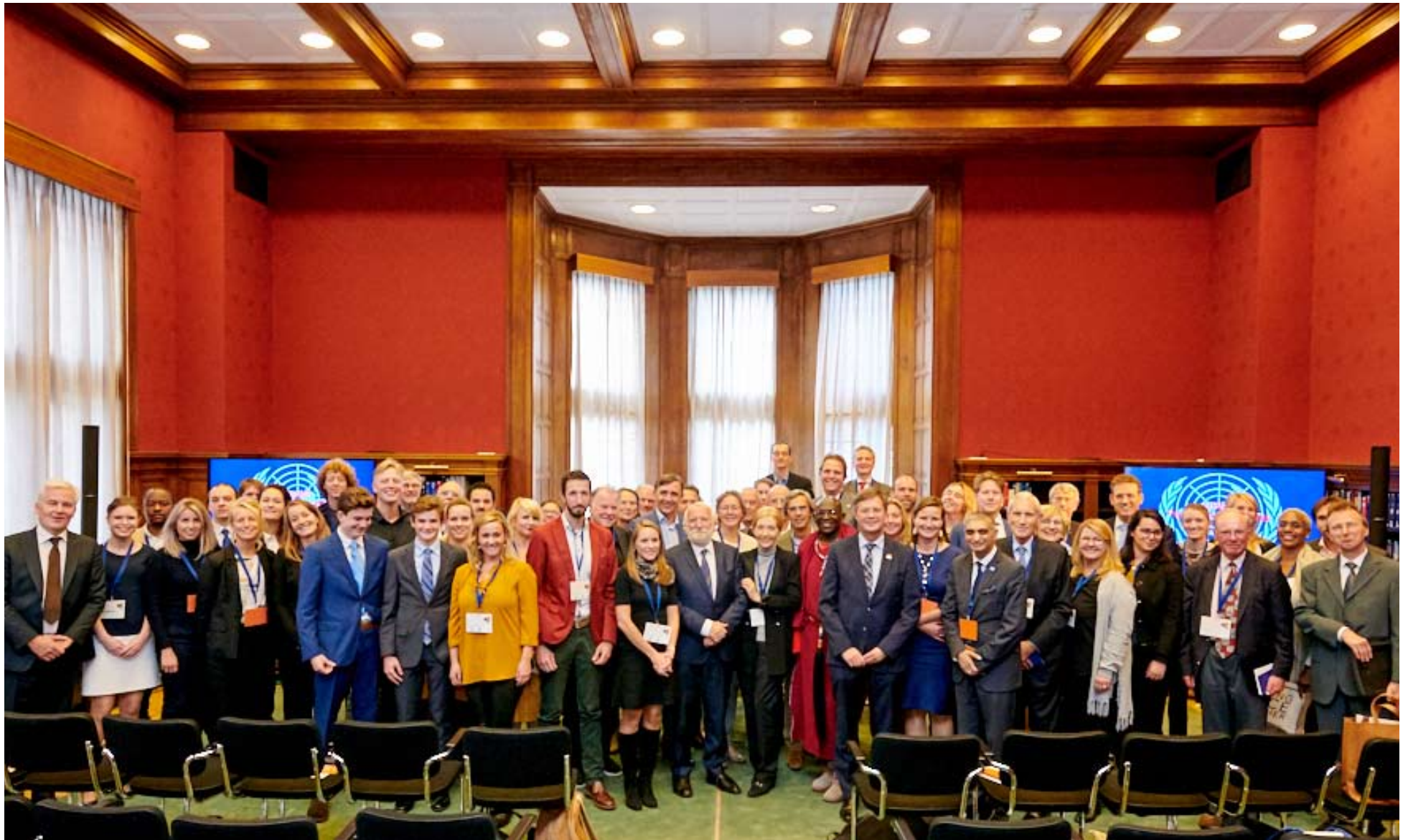
Groepsfoto van de deelnemers aan de deelsessie UDMR tijdens de Peacebuilding Conversations op 24, 25 en 26 september 2018 in het Vredespaleis.